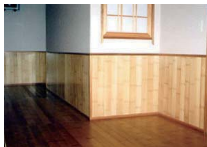
(利用例)個人住宅の腰壁と床材