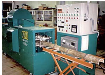
長尺竹展開平板製造装置

本装置は、竹の形状を整える前処理、加熱、展開及び冷却機構からなっています。まず半割した竹を煮沸後、本装置に投入し、一定(8mm)の厚みになるように外皮と内皮を切削します。次に41.14MHzの高周波で140℃に加熱・軟化して、側圧を加えながら順次圧延・展開し、最後に冷却して展開竹平板を製造します。