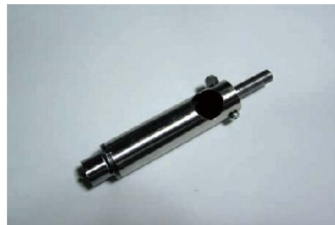
↑ 試作した本発明ドリル