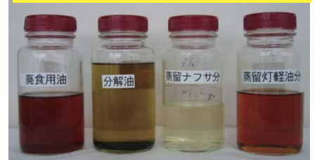
廃食用油 分解油 蒸留ナフサ 蒸留灯軽油分