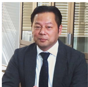
閉会挨拶(植村副会長)