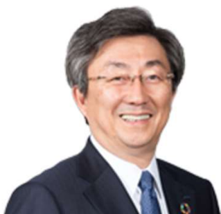
開会挨拶(小笠原会長)