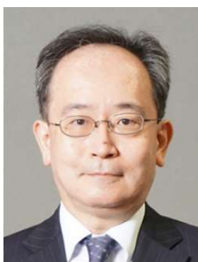
来賓挨拶(星野局長)